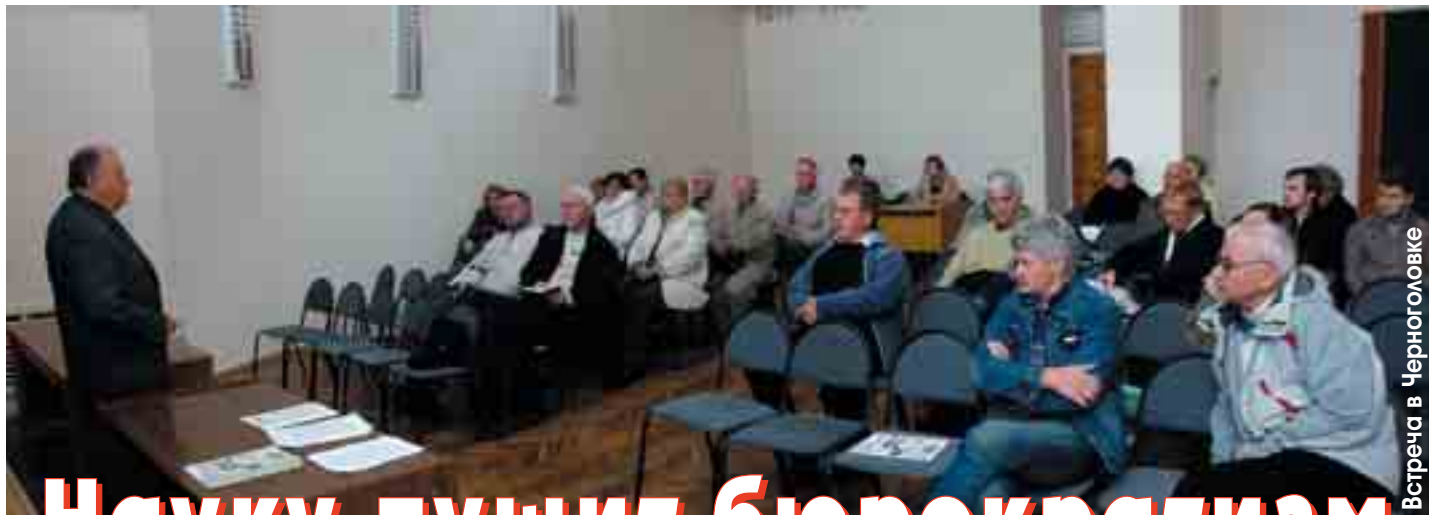
Встреча в Черноголовке