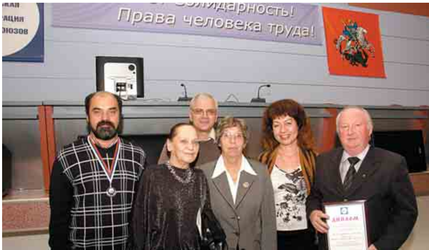
В Московской федерации профсоюзов прошло награждение лауреатов смотра-конкурса детских оздоровительных лагерей, проводимого Московской федерацией профсоюзов под девизом "Город доброй надежды - моя Москва". В число награжденных, которым в этом году подарили телефоны-факсы, попали три лагеря МРО ПР РАН - Черногловка-2009, Поречье ЖКВ РАН, "Луч" ФИАН.