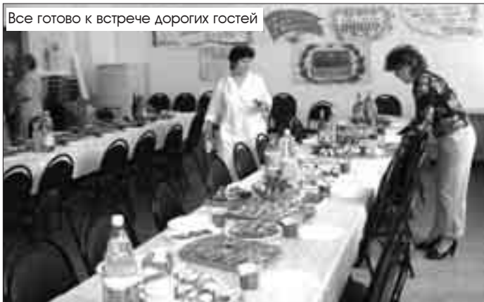
Все готово к встрече дорогих гостей