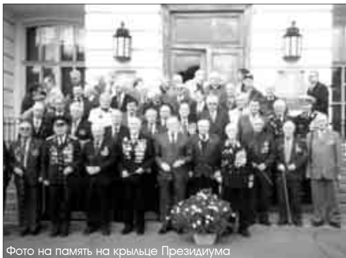
Фото на память на крыльце Президиума