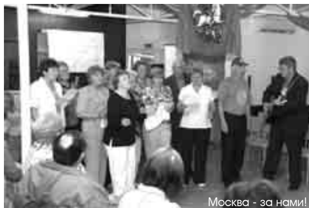
Москва - за нами!