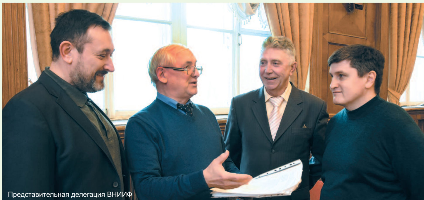
Представительная делегация ВНИИФ

На перечисленные цели ФАНО должно ежегодно выделяться примерно 160-170 млрд рублей, что примерно в два раза больше сегодняшнего бюджета агентства. Пропорционально необходимо увеличить и финансирование всей фундаментальной науки.