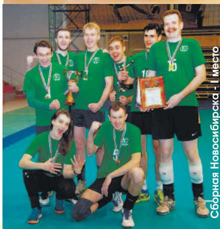
Сборная Новосибирска - 1 место