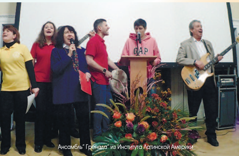
Ансамбль "Гренада" из Института Латинской Америки