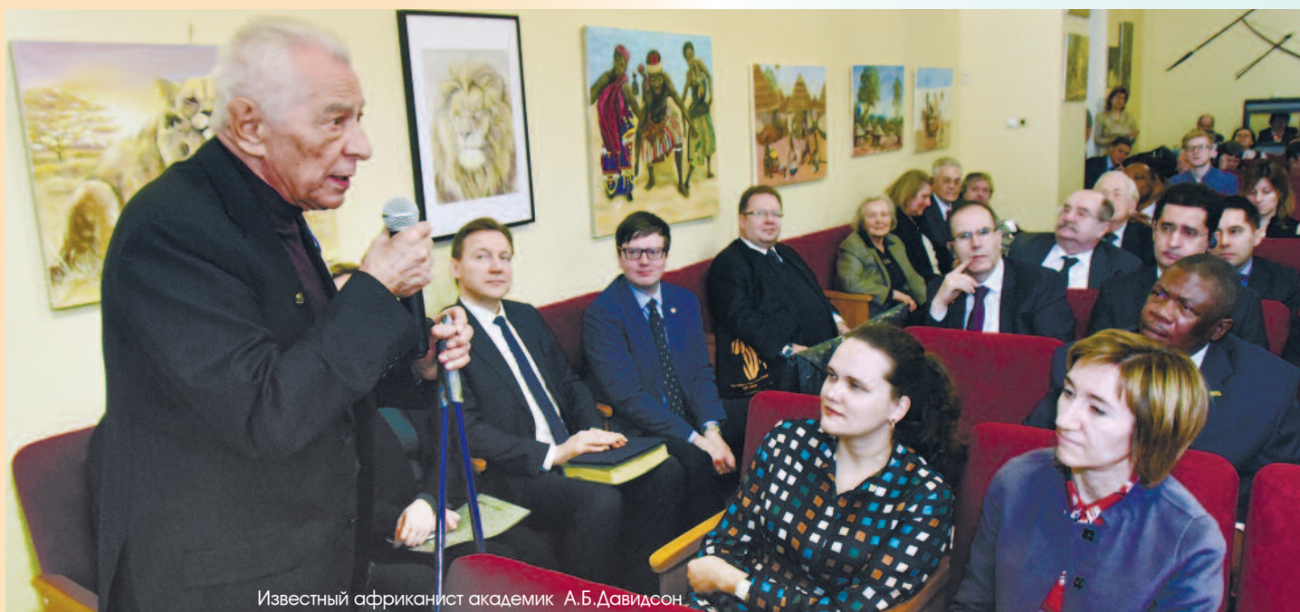
Известный африканист академик А.Б.Давидсон

теперь, после саммита, мы начнем вместе, на равных что-то строить, и Африка, наконец-то, перестанет приезжать в Россию «молить о помощи». А Чрезвычайный и Полномочный Посол Республики Южный Судан господин Чол Тонг Майя