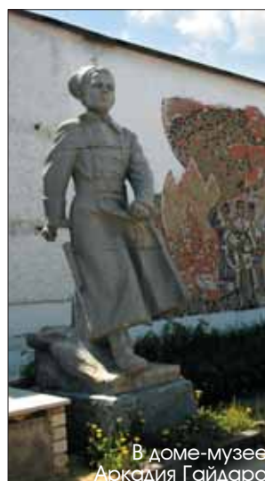
В доме-музее Аркадия Гайдара