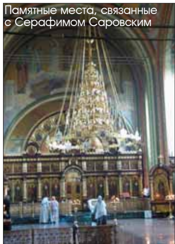
Памятные места, связанные с Серафимом Саровским