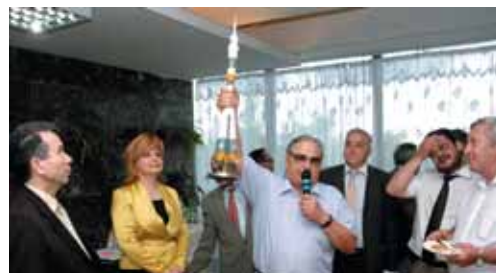
Коллектив отмечает юбилей