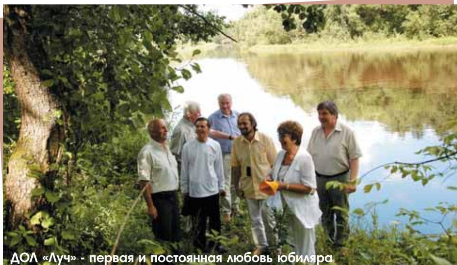
ДОЛ «Луч» - первая и постоянная любовь юбиляра

кально отличающийся от всех предыдущих. Вместе с бухгалтерией института составили форму договора подряда, которая подходит для многих случаев жизни и устраивает всех участников процесса. Кстати, грамота РАН и профсоюза - изначально фиановская инициатива. Материальную помощь мы оказываем сотрудникам, в случае необходимости, приличную. Например, бабушки и дедушки, отправляющие своих внуков в наш детский оздоровительный лагерь, получили в этом году материальную помощь на приобретение путевки в размере