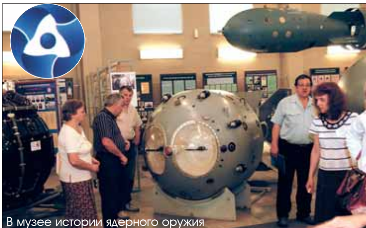
В музее истории ядерного оружия