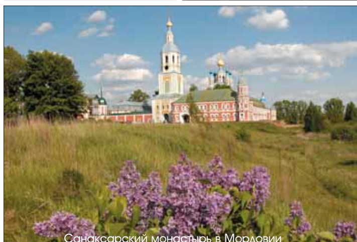
Санаксарский монастырь в Мордовии