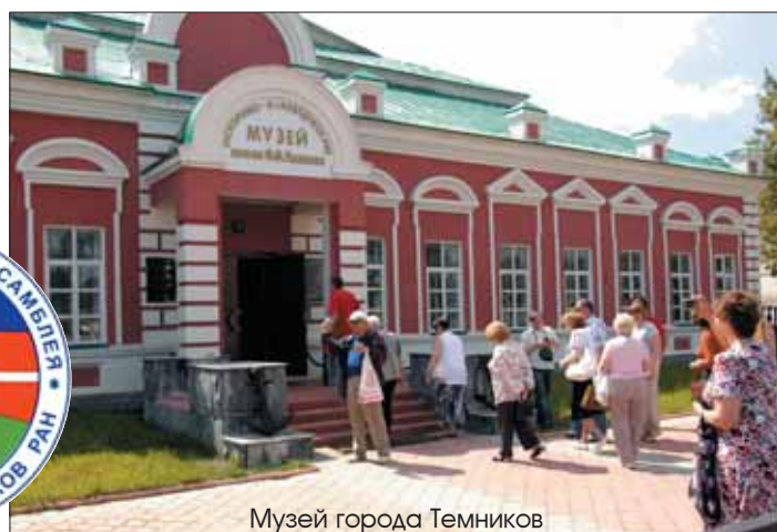
Музей города Темников

рое профсоюз атомщиков проводит ежегодно. В этом году в нем приняли участие 132 активиста, в основном - молодые люди, представлявшие все организации атомной промышленности и энергетики центра России.